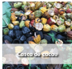
Casca de cacau

Foram ainda realizados ensaios de peletização destes materiais, tendo-se concluído, de um modo geral, que a peletização das diferentes matérias-primas apresentam bons resultados, destacando-se alguns que reúnem as melhores características.