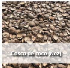
Casca de coco (Noz)