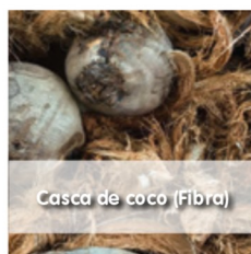
Casca de coco (Fibra)

Tendo em consideração as cadeias de produção já existentes e a pretensão de instalar uma unidade piloto de produção de energia através de uma solução tecnológica facilmente implementável e replicável em diferentes locais, foi elaborado e apresentado por uma empresa nacional um projeto de cogeração específico a instalar numa unidade industrial são-tomense que aguarda oportunidade de instalação.